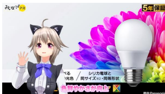
パナソニックのLED電球「プレミアX」のPR