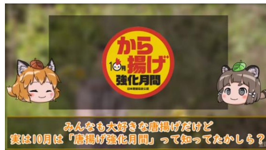
日本唐揚協会のから揚げ強化月間のPR