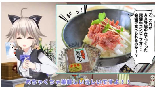
岐阜県飛騨市のイベントへの集客PR

昨年8月にサービスを開始し、多くの事案で採用されてきましたので、その一部を紹介します。